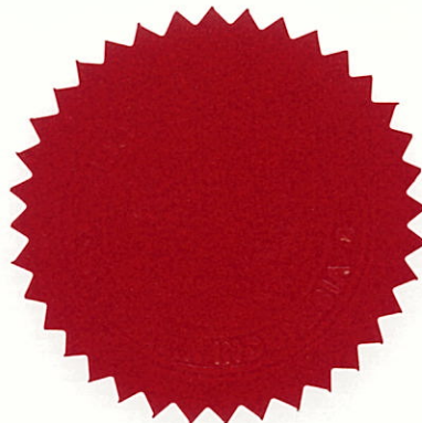
RETNO L. P. MARSUDI

DIBUAT di Jakarta pada tanggal enam belas bulan Juni tahun dua ribu tujuh belas.