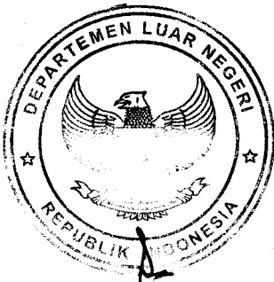
Dr. N. Hassan Wirajuda

DONE at Jakarta, this sixteenth day of July in the year two thousand and seven eight